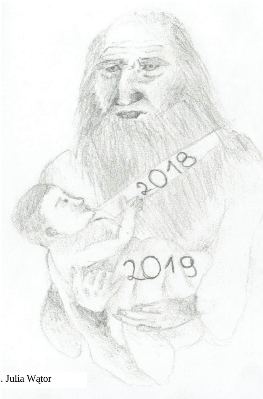
Rys. Julia Wątor

Miesięcznik redagowany przez uczniów Szkoły Podstawowej nr 2 im. Bohaterów Westerplatte w Myślenicach